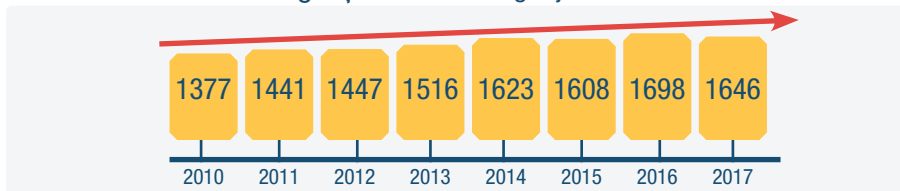
Pieaug ceļu satiksmes negadījumu skaits

Trūkst risinājumu bīstamu gājēju pāreju likvidēšanai