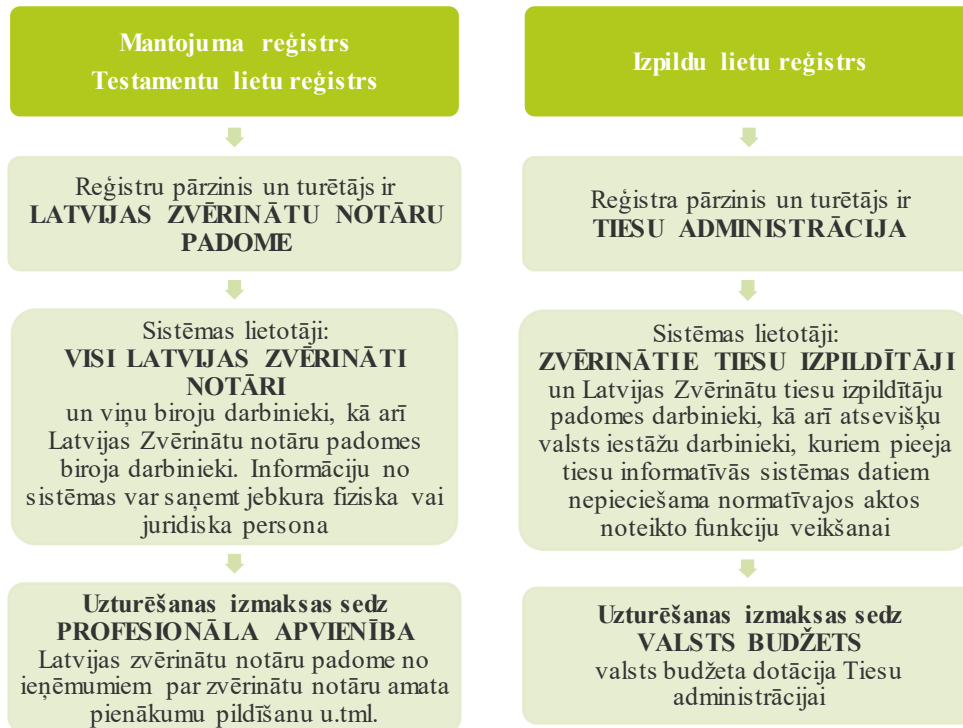
4.attēls Valsts informācijas sistēmu uzturēšanas un finansēšanas modeļu salīdzinājums 25 .

Valsts kontroles ieskatā valstiski nozīmīgu reģistru (Mantojumu reģistrs un Publisko testamentu reģistrs) uzturēšanas funkciju nodošana notāru profesionālai korporācijai, norāda uz nekoncekvenci valstij nozīmīgas informācijas glabāšanā un uzturēšanā 26 . Tā rezultātā ārkārtas situācijas laikā apstiprinājās risks sistēmas darbības nepārtrauktībai un valstij nozīmīgu datu pieejamībai, ko varēja radīt situācija, kad samazinoties notāru sniegto pakalpojumu apjomam un ieņēmumiem, pietrūka finansējums jauna servera iegādei.